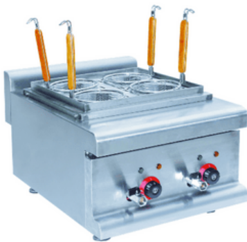
פסטה קוקר 4 סלסלות מק"ט: 12056 רוחב 40 ס"מ, עומק 65 ס"מ, גובה 40 ס"מ 4.5KW