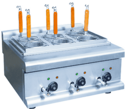
פסטה קוקר 6 סלסלות מק"ט: 12057 רוחב 60 ס"מ, עומק 65 ס"מ, גובה 40 ס"מ 6KW

לבישול פסטה בצורה מהירה ואחידה ולעבודה מאומצת במטבחים תעשייתיים. ברזי ניקוז. הגבלת בטיחות