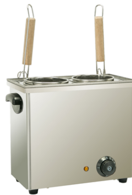
פסטה קוקר 2 סלסלות מק"ט: 12201 רוחב 37 ס"מ, עומק 23 ס"מ, גובה 30 ס"מ 2.5KW