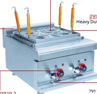
בית נירוסטה מוצק בית מכשיר מוצק, גופי חימום Heavy Duty