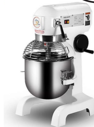
מיקסר 10 ליטר BH10