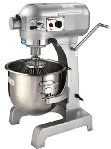
מיקסר 20 ליטר עם רשת מגן SP7MXI-B