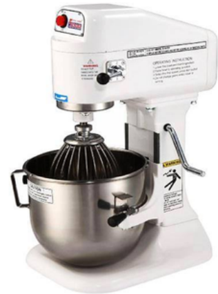
מיקסר 8 ליטר SP800