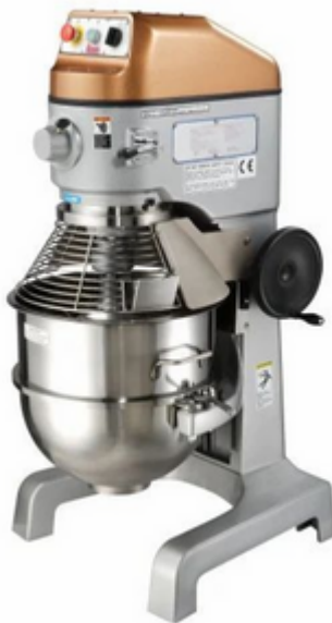
מיקסר 30 ליטר עם רשת מגן SP30HA