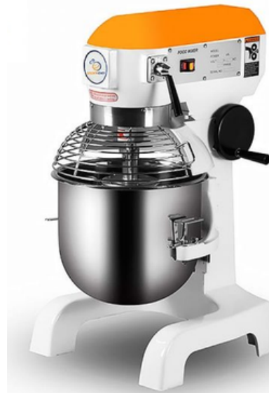
מיקסר 30 ליטר BH30