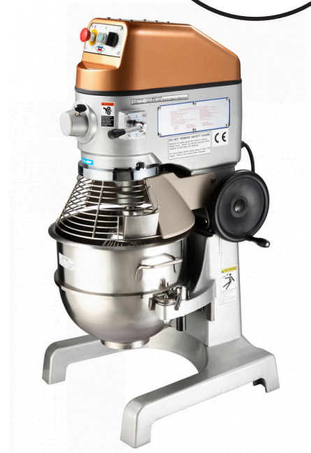
מיקסר 60 ליטר עם רשת מגן SP60HA