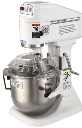
מיקסר 8 ליטר עם מכסה מגן SP800-B