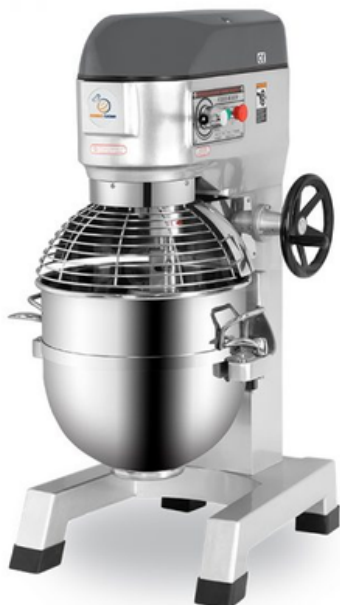
מיקסר 40 ליטר BH40