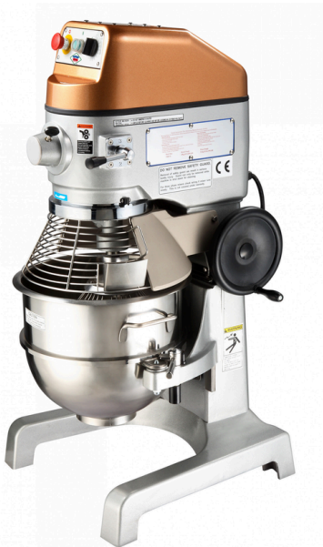
מיקסר 40 ליטר עם רשת מגן SP40HA