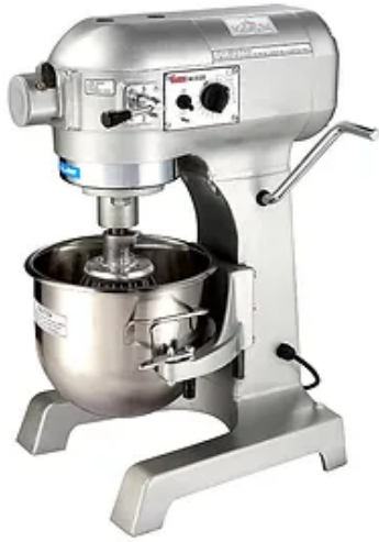
מיקסר 10 ליטר עם רשת מגן SP5MXI-B