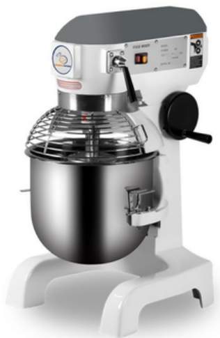
מיקסר 20 ליטר BH20