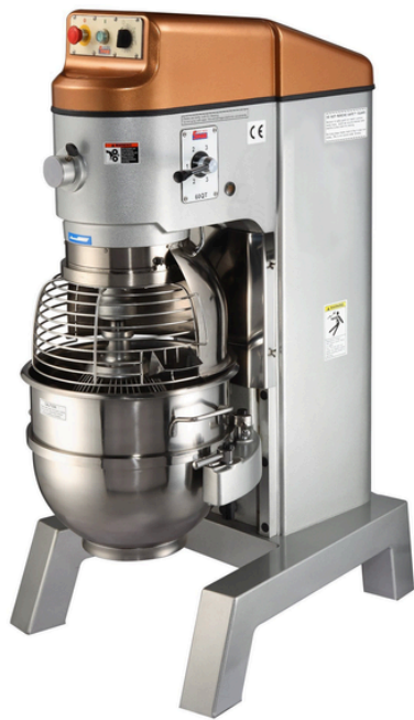
מיקסר 80 ליטר עם רשת מגן ומעלית ידינית SP60HA